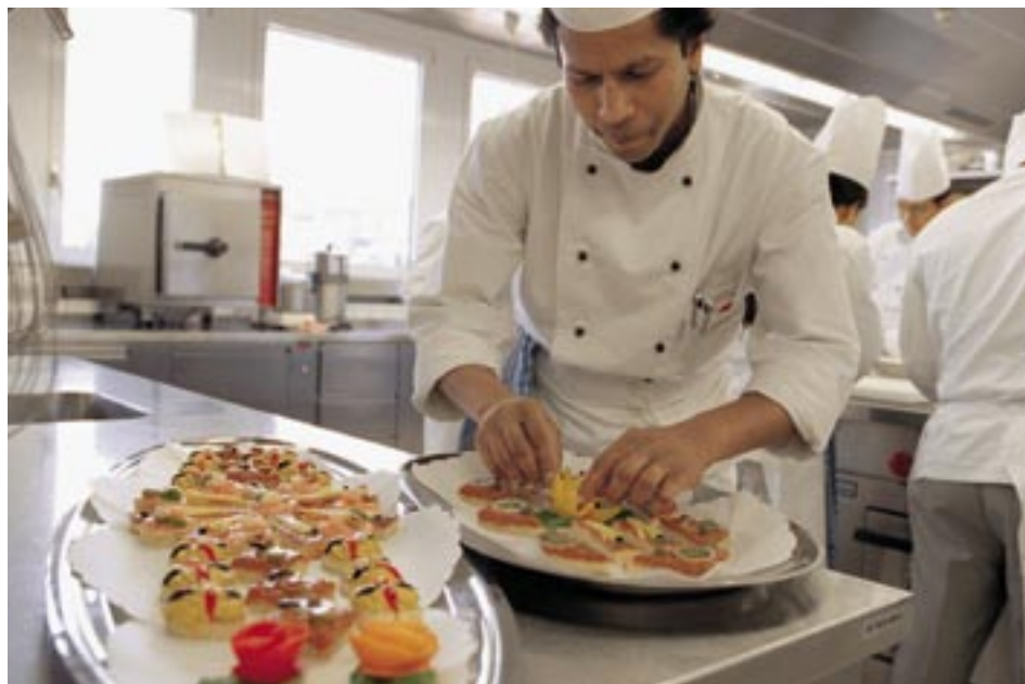
Ausländische Personen sind überdurchschnittlich von Arbeitslosigkeit betroffen, auch weil sie vermehrt in Branchen tätig sind, die mehr Arbeitslosigkeit aufweisen als andere. Daneben spielt aber auch diskriminierendes Verhalten seitens der Arbeitgeber sowie der RAV-Beratenden eine Rolle.

Ausländerinnen und Ausländer sind stärker von Erwerbslosigkeit betroffen als Schweizerinnen und Schweizer. Sie finden auch weniger häufig und weniger rasch wieder eine neue Stelle. Die durchgeführten quantitativen und qualitativen Untersuchungen zeigen, dass dies nicht zwangsläufig so sein muss. Die Phänomene sind zudem nicht nur durch die durchschnittlich schlechtere Bildung bzw. durch Sprachprobleme zu erklären. Will man die Problematik ernsthaft angehen, so müssen Instrumente und Einzelmassnahmen in der Migrations-, Bildungs-, Sozial- und Arbeitsmarktpolitik sowie der Arbeitslosenversicherung (ALV) eingesetzt und aufeinander abgestimmt werden.